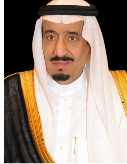
خادم الحرمين الشريفين الملك سلمان بن عبدالعزيز آل سعود