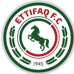
شعار الاتفاق الحالي