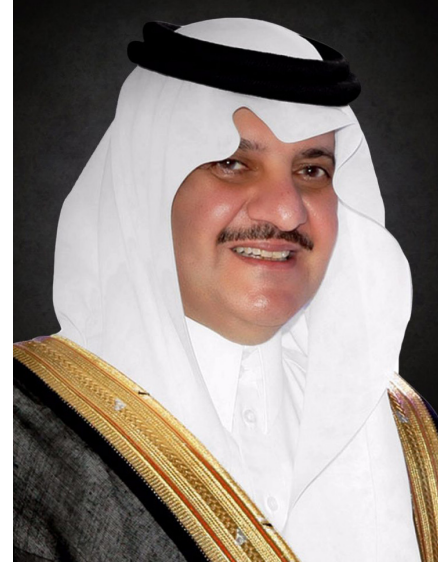
صاحب السمو الملكي الأمير سعود بن نايف بن عبدالعزيز أمير المنطقة الشرقية