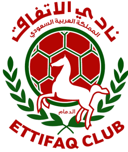
شعار الاتفاق السابق

هكذا تأسس نادي الاتفاق عام 1945 ميلادية ليكون أحد أشهر الأندية السعودية وصاحب السبق في تحقيق الإنجازات الكروية التي أصبحت بوابة العبور لعدد من الإنجازات للمنتخب السعودي فأصبح اسم نادي الاتفاق على شفاه كل عشاق المستديرة وأصبح أبناء المنطقة الشرقية يفخرون بأن أصحاب القميص الأخضر والأحمر ممثلهم على منصات التتويج المحلية والإقليمية ، واختير مدينة الدمام موقعا للنادي .