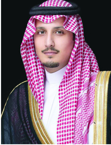
صاحب السمو الملكي الأمير أحمد بن فهد بن سلمان نائب أمير المنطقة الشرقية