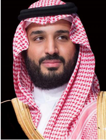
ولي العهد صاحب السمو الملكي الأمير محمد بن سلمان آل سعود